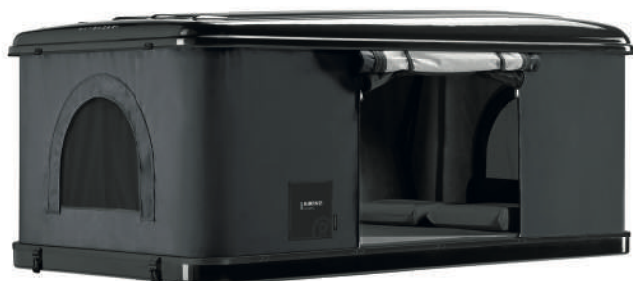
Modell Black Storm Farbe schwarz / carbon